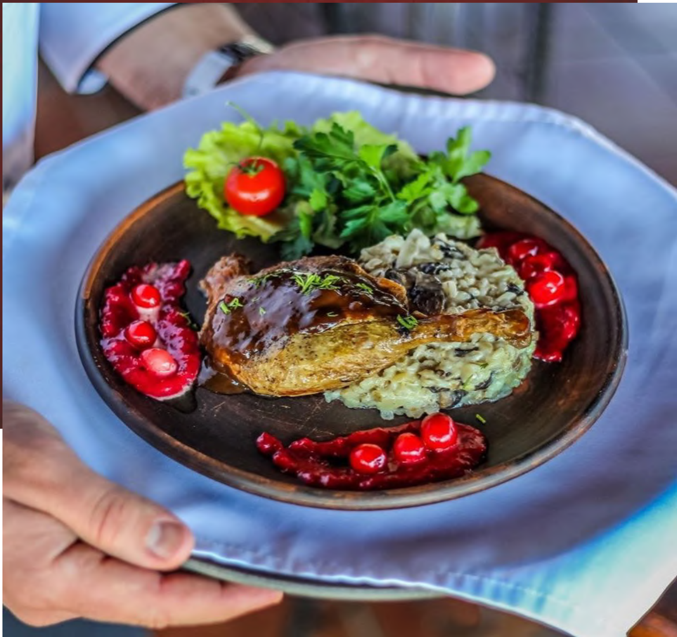
«Королевская Ассамблея Сула» Парк истории