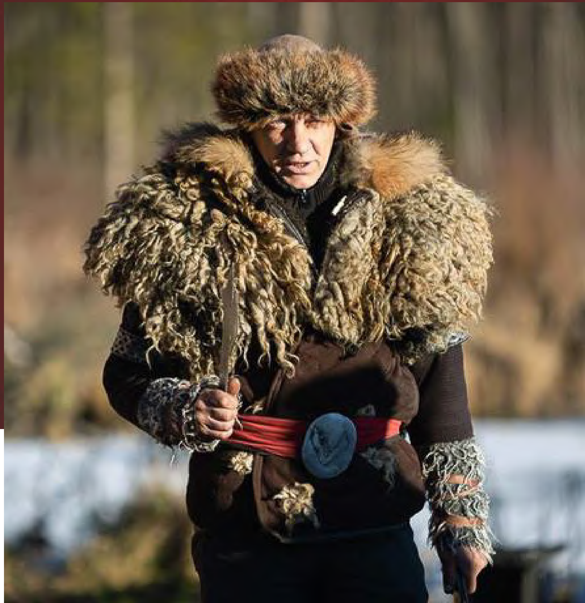
«Королевская Ассамблея Сула» Парк истории