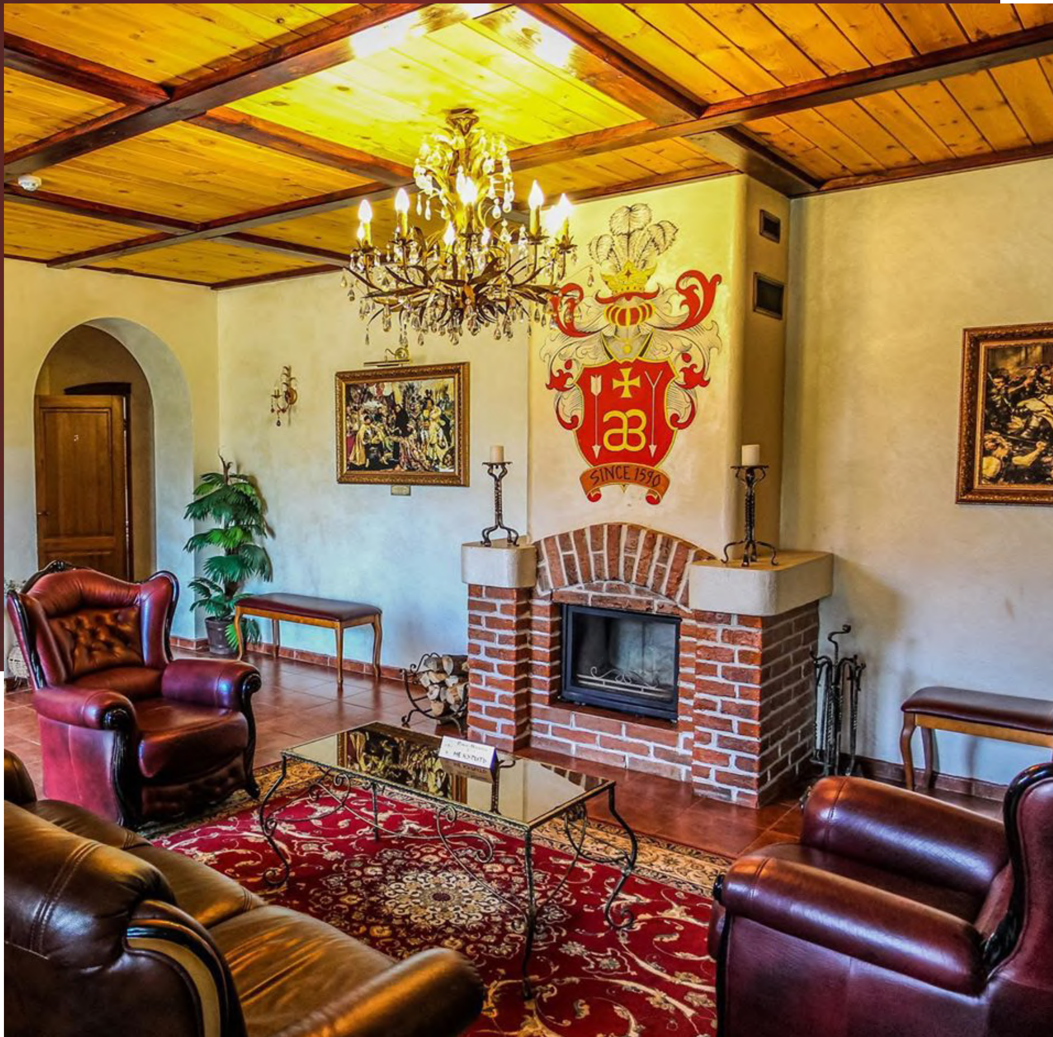
«Королевская Ассамблея Сула» Парк истории